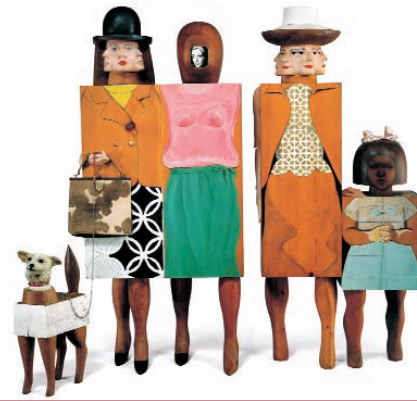
Donne e cane. Marisol Escobar, 1964. Whitney Museum of American Art, New York.