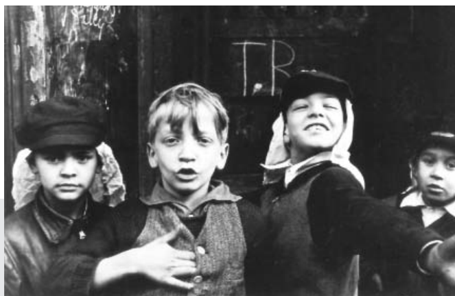
New York. Helen Levitt, ca. 1940. The Museum of Modern Art, New York.